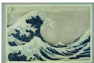
Katsushika Hokusai, Sous la vague au large de Kanagawa