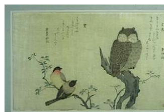
Kitagawa Utamaro, Hibou sur un tronc d'arbre et deux rouges-gorges