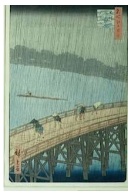
Utagawa Hiroshige, Ohashi, averse soudaine à Atake