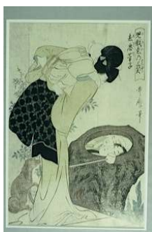
Kitagawa Utamaro, Eon Hoshi