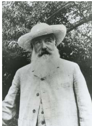
Claude Monet dans son jardin, photographié par Sacha Guitry vers 1913