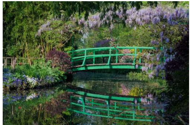
Vue du jardin d'eau Maison et Jardins Claude Monet. Giverny