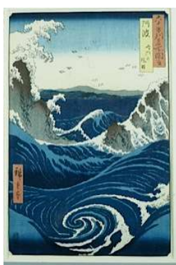
Utagawa Hiroshige, Vue des tourbillons de Naruto à Awa